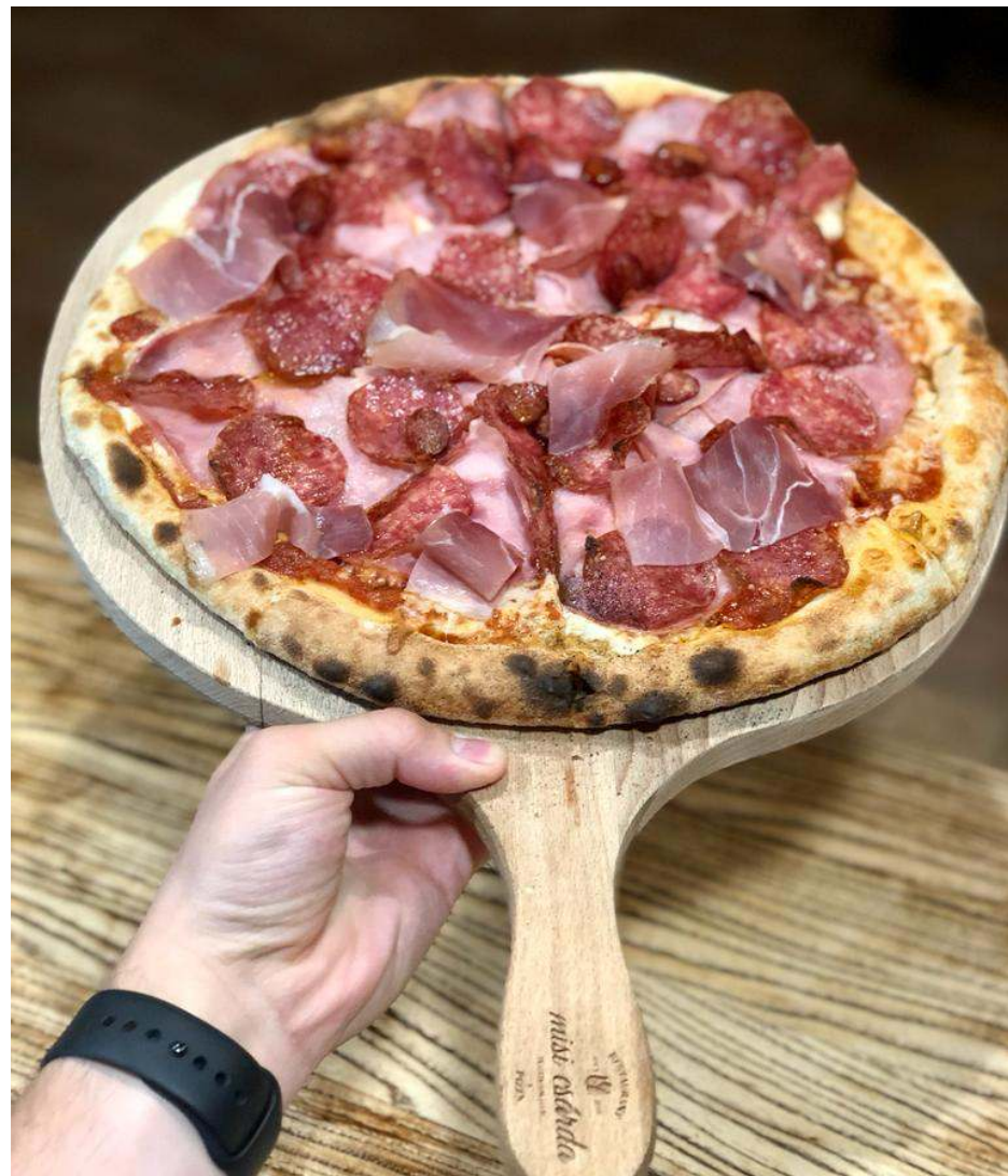
PIZZA QUATTRO CARNI