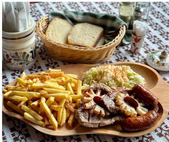
PREFERATUL LUI MISI

Meniu Crispy (1,3,7, ❄️) 44,00 lei (1 persoană) 200/200/50gr (crispy de pui, cartofi pai, sos de usturoi)