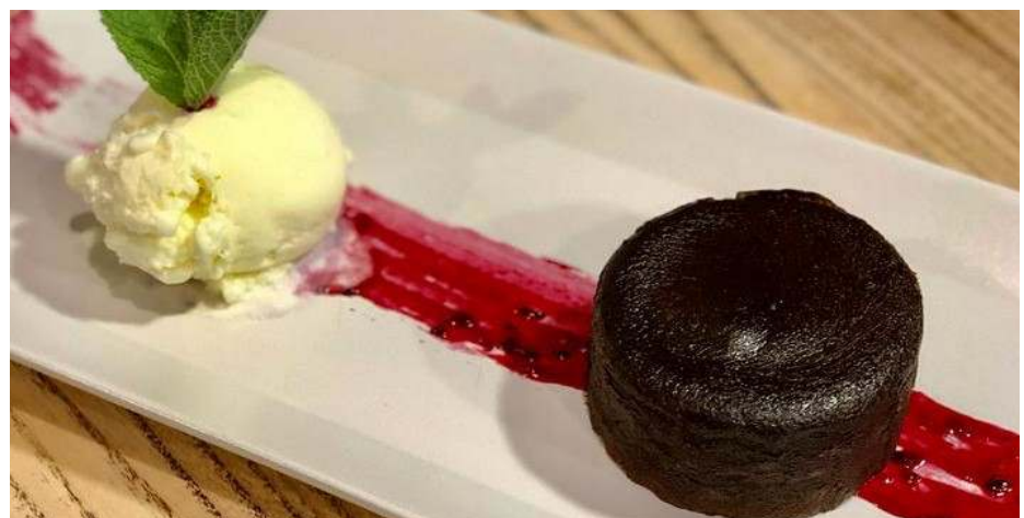
LAVA CAKE CU ÎNGHEȚATĂ DE VANILIE