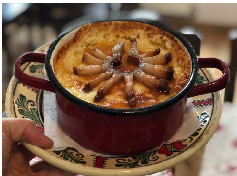
MĂMĂLIGĂ CU BRÂNZĂ